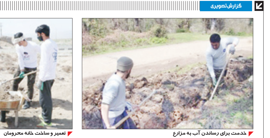
خدمت برای رساندن آب به مزارع