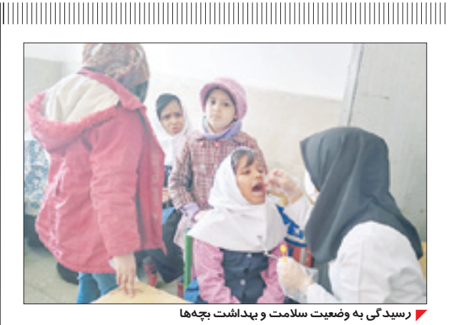
رسیدگی به وضعیت سلامت و بهداشت بچه‌ها

با توجه به خشکسالی‌هایی که طی سال‌های اخیر گریبان کشور و زنجان را گرفته، هم اکنون یکی از دغدغه‌های اصلی استان‌ها در بحث تأمین آب می‌باشد. کار بزرگی در مرکز صورت گرفته که بر اساس آن سپاه با همکاری دولت و مجلس هماهنگی‌های بسیار خوبی داشته و قرارگاه امام حسن مجتبی (ع)، راه‌اندازی و فعال شده است. در همین رابطه و در سال جاری پروژه‌هایی در استان زنجان آغاز شده که در ابتدای سال کار ابرسانی به ۵۷ روستا شروع و قرار است این تعداد تا دو برابر افزایش یابد. چند روز پیش که وزیر نیرو در زنجان بود تصمیمات خوبی برای نحوه ابرسانی به روستاها اتخاذ شد و در حوزه سپاه نیز مصوب شد هزینه ابرسانی به ۱۱۰ روستای کآب یا آب تأمین و کارها به سرعت آغاز شود. به گفته فرمانده سپاه انصارالمهدی (عج)، این نیرو در خدمات‌رسانی‌هایش از تمام امکانات موجود در روستاها استفاده می‌کند و مردم پای کار هستند. یعنی وقتی لوادر یا ماشین‌های بسیار خوبی از رسانه ملی بخش شد ۶۵۰ هزار بسته بهداشتی در آن مقطع در میان شهروندان توزیع شد تا راه را برای شیوع کرونا ببندیم.