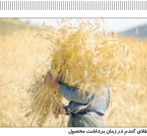
رنگ طلای گندم در زمان برداشت محصول