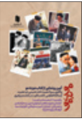
روی جلد کتاب