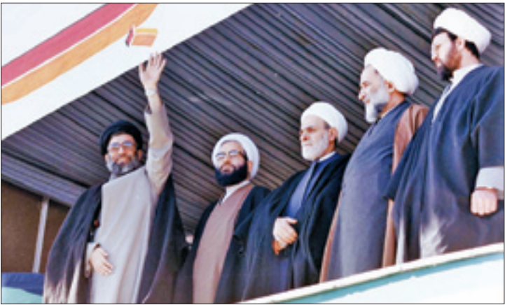
شهید آیت‌الله فضل‌الله مصلحتی در کنار رهبر معظم انقلاب

«صلح و سازش مبنای عقلایی و شرعی دارد و در مسائلی که به داور ارائه می‌شود، با توجه به اینکه داور را خود افراد انتخاب می‌کنند، رضایت‌مندی بیشتری از نتیجه داور می‌آید. مزیت دیگری که داورها دارند، این است که سرعت رسیدن به نتیجه در داورها، بیشتر از دستگاه قضاست و در عین حال، منافع بیشتری برای طرفین دعوادارد.» این سخنانی است که