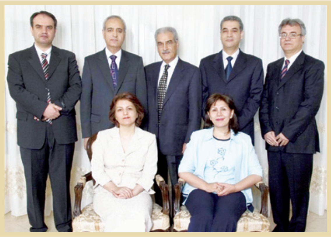
اعضای تشکیلات موسوم به «باران ایران»،مدیران وطنی جامعه بهائی

ادعای بهائیان مبنی بر نقض حقوق آنان در ایران، در حالی مطرح می‌شود که طبق قوانین رژیم اشغالگر قدس، اعضای این فرقه در عکا و حیفا حق تبلیغ ندارند! با وجود غیرقانونی بودن همین مسئله در ایران، در سال‌های پس از پیروزی انقلاب، آنان نه تنها به تبلیغ و ترویج بهائیت پرداخته‌اند، بلکه به عنوان ستون پنجم صهیونیسم، انگلیس و امریکا عمل کرده‌اند. تشکیلات بهائیت برای داغ کردن فضا در کشورمان، به اعضای خود دستور به مقاومت مدنی می‌دهد و آن را به عنوان دستاویزی برای هجمه به نظام مطرح می‌کند