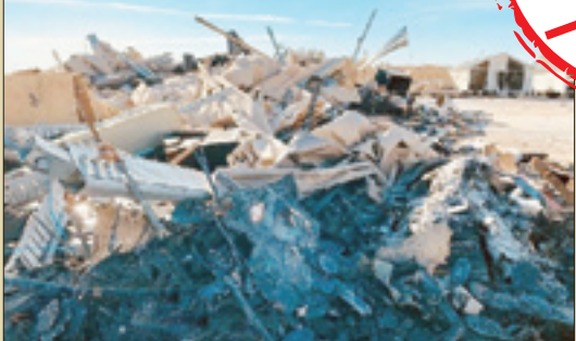
آسیب موشک اصابت کرده در ساختمانی با چند ده متر فاصله مشهود است