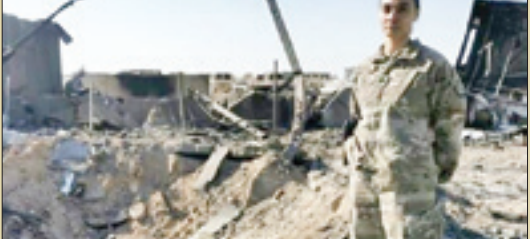
سروینگ دوم کیسی کلنم در کنار محل اصابت یکی از موشک‌ها