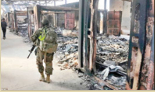
وضعیت اتاق‌های کنترل پهلوها صبح روز بعد از حمله