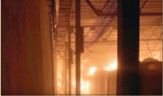
آتش سوزی دقیقی پس از حمله در مجموعه اتاق‌های کنترل پهلوها