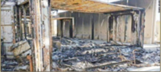
بخش کنترل پهلوها که نابود شده است

تصویر ماهواره‌ای منتشر شده توسط منابع غربی از پایگاه عین‌الاسد پس از تهاجم ایران، گویای دقت کم‌نظیر موشک‌های ایرانی بود. تعدادی از سوله‌ها و ساختمان‌های این پایگاه در بخش تحت اختیار امریکا از بین سوله‌ها و ساختمان‌های متعدد مورد اصابت قرار گرفته بود. به طور کلی این اهداف شامل محوطه استقرار بالگردهای رزمی آپاچی، محوطه استقرار بالگردهای پشتیبانی بلک هاک، محوطه استقرار پرندهای عملیات ویژه تیلت روتور V-22 و نیز سوله استقرار پهلوها، اتاق عملیات پایگاه و مرکز کنترل عملیات پهلوهای این پایگاه بود، اما نکته محرمانه مانده، علت انتخاب یک سوله یا ساختمان خاص از بین چند سوله و ساختمان مجاور هم بود. احتمالاً عوامل نفوذی و شناسایی سپاه از قبل اطلاعات قبلی از ماهیت ساختمان‌های این پایگاه کسب کرده و در طبقه‌بندی اهداف مختلف در آن کارهای اطلاعاتی و جاسوسی کافی انجام داده‌اند. به گفته ژنرال کنت مک‌کنزی، فرمانده سنکام که شخصاً فرماندهی عملیات ترور شهید سلیمانی را هم بر عهده داشت، ارتش تروریست آمریکا دقت موشک‌های ایرانی را در عملیات‌های قبلی رصد کرده بود اما با اصابت این موشک‌ها به پایگاه امریکایی‌ها آنها دقت بالای موشک‌های ایرانی را از نزدیک لمس کردند. به طور کلی اثبات مجدد دقت کم‌نظیر و قابلیت اطمینان بالای موشک‌های ایرانی برای کارشناسان دنیا، انهدام آسانه‌های مهم پشتیبانی از عملیات نظامی هواگردها و انهدام مرکز فرماندهی و کنترل عملیات پهلوهای در این پایگاه را می‌توان از رؤس دستاوردهای نظامی این عملیات دانست.