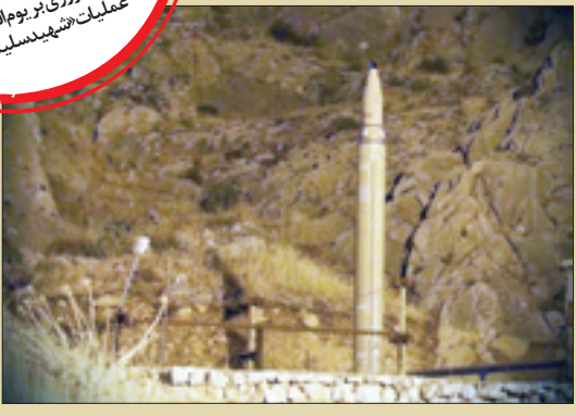
نمونه هدایت شونده و نقطه زن موشک قیام در عملیات ضربت محرم در مهر ۱۳۹۷