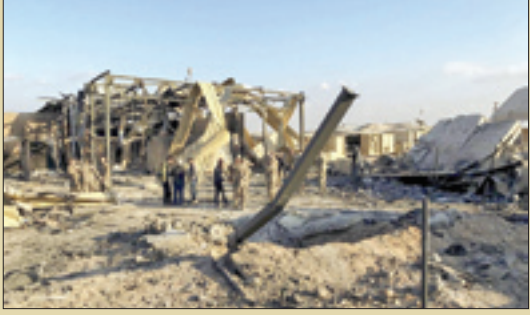
نابود شدن محوطه ساختمان و اتاق‌های کنترل پهلوها