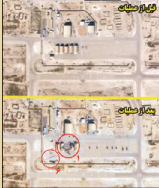
مقایسه آثار حمله موشکی در مورد از اهداف