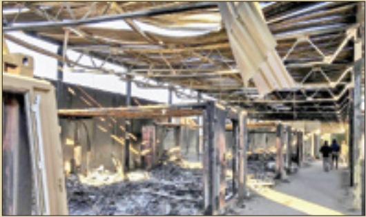
وضعیت اتاق‌های کنترل پهلوها صبح روز بعد از حمله

هر چند تا مدت‌ها حضور امریکایی‌ها در پایگاه‌های متعدد در اطراف ایران به عنوان اهرمی برای فشار بر سیاستمداران ایرانی استفاده می‌شد اما تلاش مخلصانه رزمندگان موشکی سپاه و صنعت دفاعی سبب شد پایگاه‌های امریکایی در اطراف ایران به نقطه ضعف آنها تبدیل شود، چون حاصل زحمات شبانه‌روزی متخصصان داخلی سبب شد نقطه قوت ایران حملات موشکی آن باشد. امروزه توان موشکی کشور با رسیدن به موشک‌های هایپرسونیک با قابلیت مانورهای متعدد به نقطه‌ای رسیده است که انواع پدافندهای ضد موشکی دشمن هم قابلیت مقابله با این فناوری را ندارد، در نتیجه حملات برقی آسای موشکی ایران باز هم تا سال‌ها برگ برنده مجموعه نظامی کشور خواهد بود.