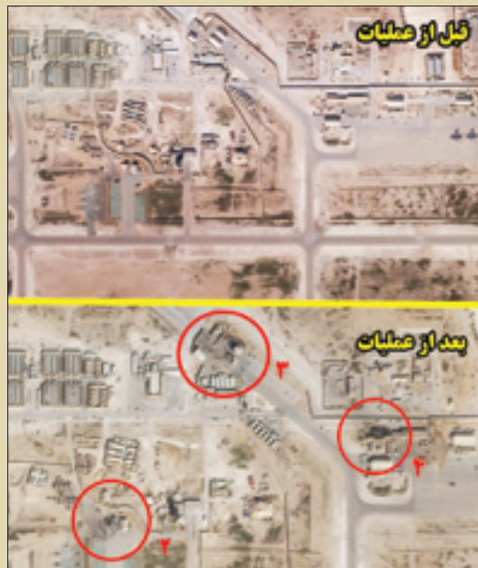
نقاط اصابت به سه مورد از اهداف قبل و بعد از عملیات