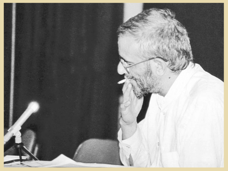
مهدی هاشمی معدوم در دادگاه

مهدی هاشمی در سال ۱۳۲۳ ش، در قهدرجان از توابع نجف‌آباد اصفهان به دنیا آمد. پدرش روحانی و از اساتید آیت‌الله حسینعلی منتظری بود و خودش خواهرزاده همسر آیت‌الله منتظری. برادرش نیز داماد آیت‌الله منتظری بود. او پس از گذراندن تحصیلات ابتدایی و به اصرار پدرش، تحصیل علوم دینی را آغاز کرد. ابتدا در حوزه علمیه اصفهان و سپس در حوزه علمیه قم درس خواند. با شروع نهضت امام خمینی(ره)، وارد عرصه مبارزه با رژیم پهلوی شد. از آنجا که مهدی هاشمی از همان ابتدای ورود به دنیای طلبگی، به دلیل علاقه به گروه‌های مبارز چپ، مطالعات مارکسیستی زیادی داشت و در مقابل آن مطالعات دینی اندکی برخوردار و در سطح دروس حوزوی باقی مانده بود، افکار مبارزاتی وی، دچار التقاطی شدیدی شد. به ویژه اینکه او در دوره تحصیل در حوزه اصفهان، تحت تأثیر افکار یکی از اساتیدش به نام سیدمحمدجواد غروی قرار گرفته و تفکرات واهی مآب هم پیدا کرده بود.