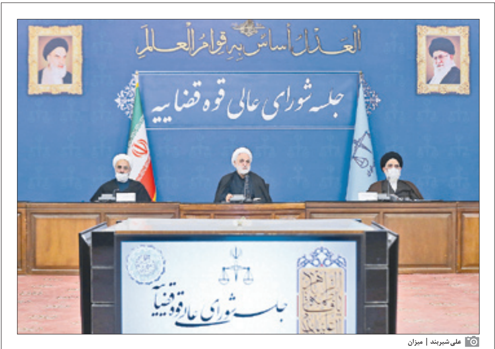
علی‌شربند | میزان

اثرات دیدار مستقیم و بدون واسطه مقامات و مسئولان قضایی با مردم و مراجع پی‌د عدلیه از جهات مختلف، هم به لحاظ پیشبرد پرونده آنها و هم از حیث ایجاد پار قضا‌های امید در مردم بسیار مطلوب است و من بازتاب رضایت مردم از این ملاقات‌های بدون واسطه و چهره‌به‌چهره را در یافت کردم. به گزارش مرکز رسانه قضا‌ئیه، حجت‌الاسلام والمسلمین محسنی‌اژه‌ای صبح دیروز در جلسه شورای عالی قوه قضائیه با اشاره به گزارشی از سفر اخیر به استان گلستان، ضمن تشریح از همکاران قضایی خود و اذعان به سختی و مشقت کار آنها تصریح کرد: روز پنجشنبه در سفری که به استان داشتم، همکاران قوه قضائیه در گرگان و مهن‌رسان‌های مختلف استان در میان مردم حضور یافتند و از نزدیک به بخش‌های مختلف قوه قضائیه سرکشی کردند و بیش از گذشته به مشکلات استان گلستان، مشکلات مردم و وحامات همکاران قضایی خود، در این استان واقف شدند.