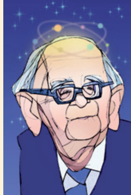
پر فسور حسابی