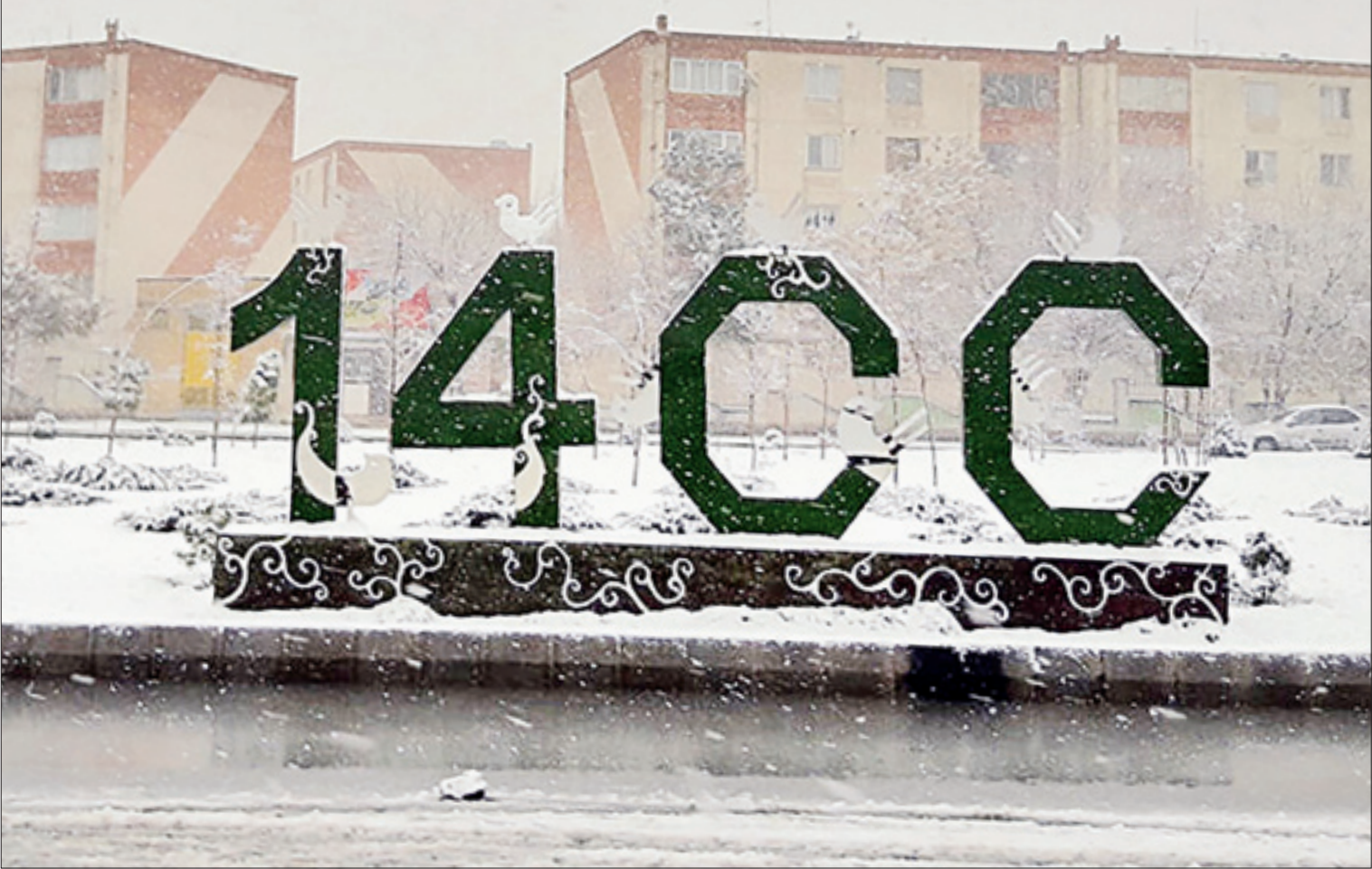
کریم نوبختی ایران

حالا دیگر وقت مدیریت در ست مدیران آبی کشور است که این خزائن آبی را به باد ندهند | صفحه ۳