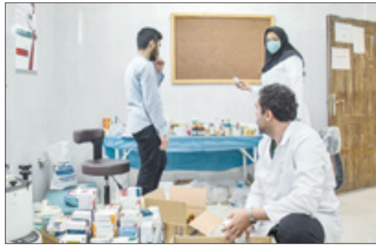
ارسال دارو به روستاهای کم‌برخوردار