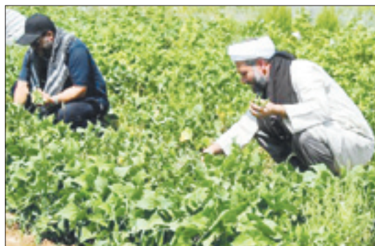
روحانیون بسیجی همراه با کشاورزان برای برداشت محصول