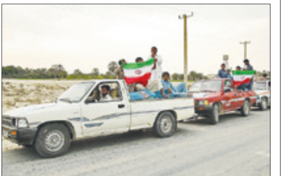
اعزام جهادگران به مناطق محروم برای انجام پروژه‌ها