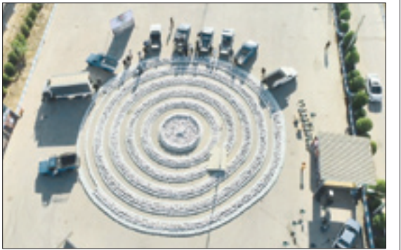
آماده‌سازی بسته‌های معیشتی و ارسال برای نیازمندان