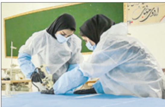
تأمین نیازهای بیمارستانی در کارگاه‌های جهادی