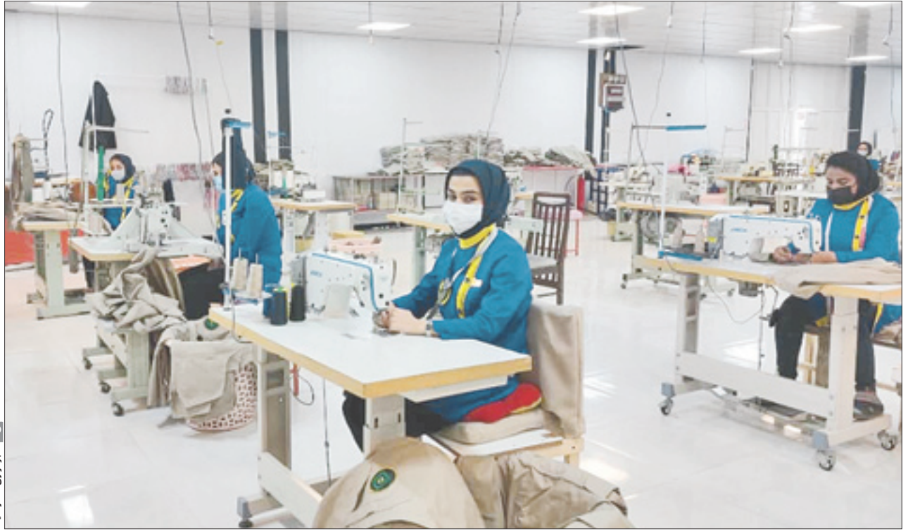
عزیزبختی در کارگاه

چند سالی است که خوزستان با حوادث زیادی از جمله سیل، خشکسالی، گرد و غبار، گرمای طاقت فرسا و قطعی برق و زلزله و دیگر اتفاقات مواجه است. به همین خاطر شاید پیراهن نباشد یگویی گروه‌های جهادی مستقر در این استان بیش از گروه‌های دیگر در تلاش و تکاپو برای کمک به هموطنان آسیب دیده و کم بر خوردار و همچنین رفع محرومیت از روستاها هستند. اما این تمام ماجرا نیست و افتتاح کارگاه بزرگ