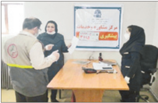
ارائه خدمات مشاوره‌ای به خانواده‌ها