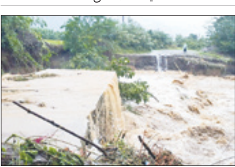
سیداحمد هاشمی اشکا