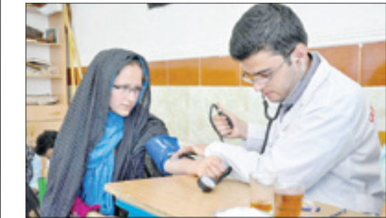
حضور در مناطق محروم و ارائه خدمات بهداشت و سلامت

گندمکار نمونه کشوری با اشاره به حمایت بنیاد برکت از کشاورزان می‌گوید: «از طریق حمایت‌های بنیاد برکت محصول گندم کشاورزان بیمه می‌شود و با توجه به اینکه منابع آب زیرزمینی گندمکار نمونه کشوری با اشاره به حمایت بنیاد برکت از کشاورزان می‌گوید: «از طریق حمایت‌های بنیاد برکت محصول گندم کشاورزان بیمه می‌شود و با توجه به اینکه منابع آب زیرزمینی