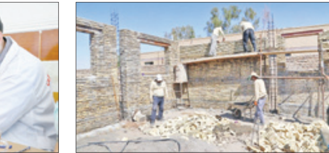
ساخت مسجد و خانه عالم برای روستاییان