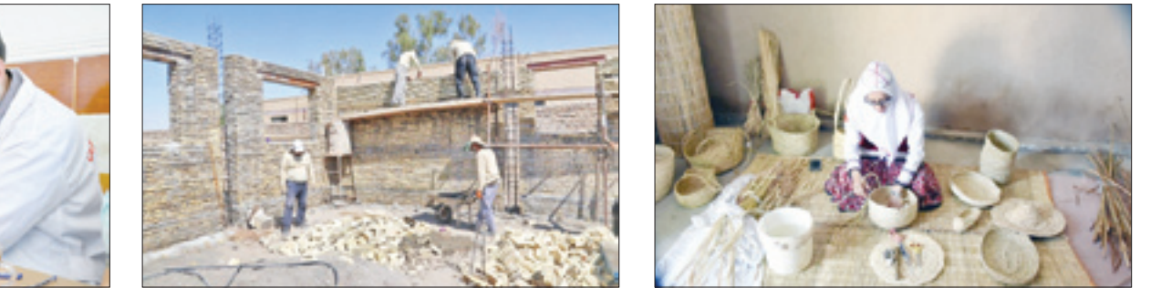
آموزش ساخت صنایع دستی به خانواده‌ها