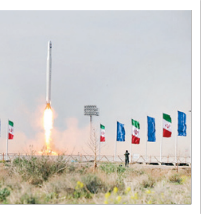
ماهواره علمی و تحقیقاتی نور ۲ نیروی

هوافضای سپاه پاسداران انقلاب اسلامی روز گذشته پر تراب شد و با موفقیت در مدار ۵۰۰ کیلومتری زمین قرار گرفت.