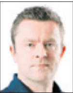
اندی هالندر گاردین