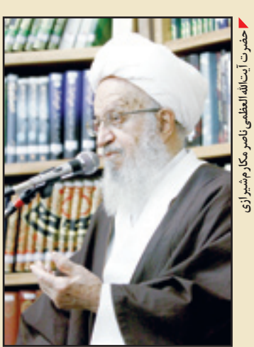
حضرت آیت‌الله العظمی ناصر مکارم‌شیرازی

«این کتاب شرح حال فشرده زندگی شخصیتهی است که از روز نخست، فکر و بیان خود را وقف اسلام و مبارزه با انحرافات فکری و اخلاقی کرد و ۶۰ سال از عمر با برکت خویش را در راه ابلاغ حقایق دین و نشر معارف و مکارم والای اهل بیت (علیهم‌السلام) بذل کرده است. زندگی سراسر مقرون با موفقیت‌دانشمندی فرزانه که در پرتو نیوچ ممتاز و استعداد کم‌نظیر و همت و پشتکار خود، از مذمت بدخواهان و فشار دشمنان، هراسی به دل راه نداد و با قبول محرومیت، تبعید، خطرپذیری و رفتن تا مرز شهادت، با قلم و بیان، سنگر بیدارگری، اصلاح‌طلبی و افشاجری در مقابل ظلم و بیداد را پاس داشت. ستاره‌ای پر فرورغ که قلم هدایتگرش،