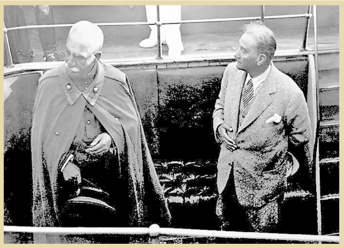
رضاخان در کنار مصطفی کمال آتاتورک در سفر به ترکیه

گذری بر زمینه‌ها و پیامدهای انعقاد پیمان سعدآباد