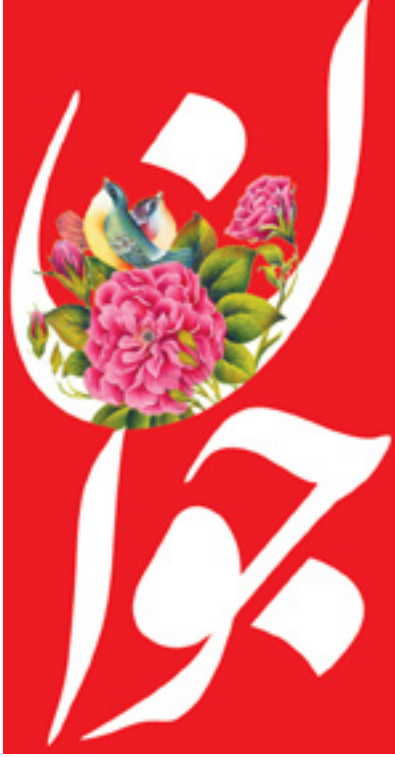
امیر المؤمنین امام علی(ع) را تبریک می گوئیم

روزنامه سیاسی، اجتماعی و فرهنگی صبح ایران دوشنبه ۲۵ بهمن ۱۴۰۰ - ۱۲ رجب ۱۴۴۳ سال بیست‌و‌چهارم - شماره ۶۴۲۵ - ۱۶ صفحه قیمت: ۲۰۰۰ تومان