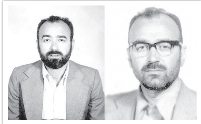
شهید اندرزگو در ظاهرها هویت‌های مختلف

هنگامی که سیدعلی اندرزگو مخفیانه به ایران بازگشت، تصمیمی مهم گرفته بود. هدف او این‌بار تورو شخص شاه بود. این تصمیم شهید باوچ گبری حرکت‌های مردم در انقلاب اسلامی در ماه رمضان ۱۳۵۷ مصادف شده بود. هنگامی که سیدعلی اندرزگو خود را برای تورو شاه در روز بیست و سوم ماه مبارک رمضان آماده می‌کرد، ساواک بار دیگر از حضور او در ایران مطلع شد. از آن جایی که عوامل رژیم پهلوی می‌دانستند در شرایط بحرانی