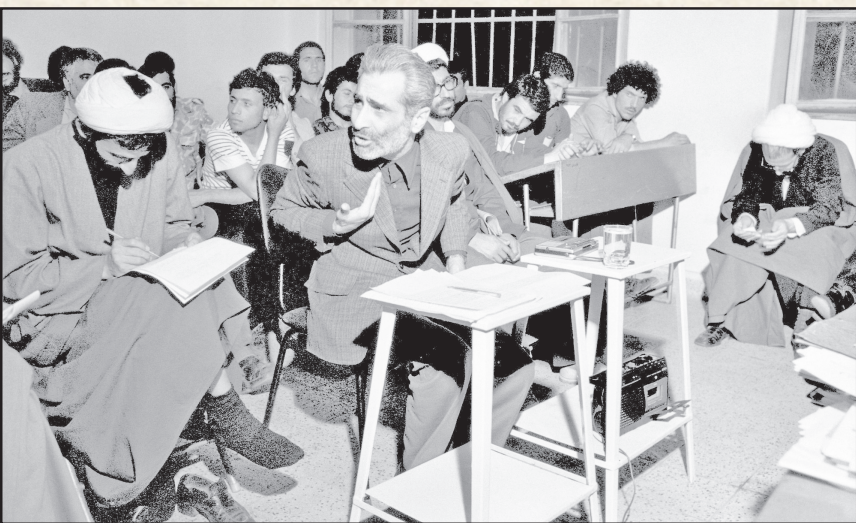
۶ فروردین ۱۳۵۸. منوچهر آزمون وزیر کار و امور اجتماعی در دولت میرعباس هویدا، در حال ایراد دفاعیات خویش در دادگاه انقلاب اسلامی. در تصویر مهدی کربویی نیز دیده می‌شود