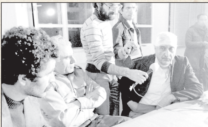
۳ بهمن ۱۳۵۷. مدرسه رفاہ، آغازین ساعات دستگیری نعمت‌الله نصیری رئیس سابق ساواک و مهدی رحیمی فرماندار نظامی تهران. رسول صدرعاملی در حال مصاحبه با آنهاست