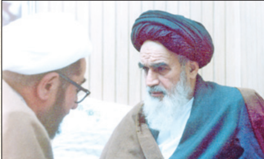
۱ امام خمینی در ۱۵ اسفند ۱۳۵۷، طی حکمی به آیت‌الله صادق خلخالی، وی را به عنوان حاکم شرع در دادگاه‌های انقلاب اسلامی منصوب کردند

آیا سران رژیم پهلوی بدون محاکمه اعدام شدند؟