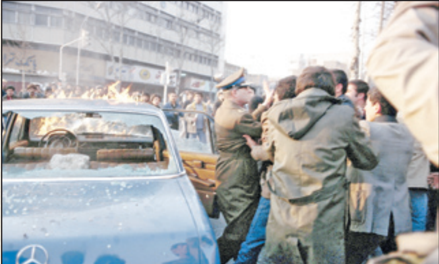
۲ بهمن ۱۳۵۷. لحظه دستگیری تقی لطیفی رئیس آجودانی شهربانی کل کشور، در خیابان کارگر تهران به دست مردم