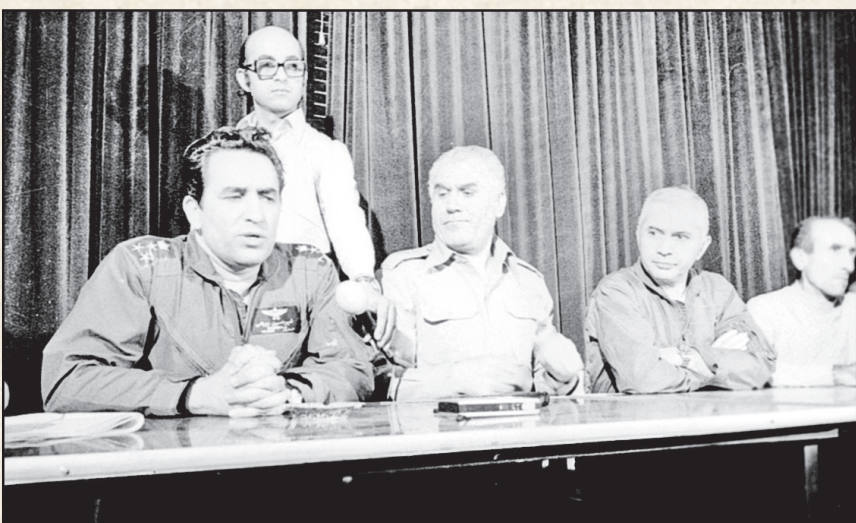
۴ مدرسه رفاہ، از چپ: امیرحسین ربیعی فرمانده نیروی هوایی ارتش، مهدی رحیمی فرماندار نظامی تهران، منوچهر خسرو داد فرمانده هوای نیروی و رضا ناجی فرماندار نظامی اصفهان، پس از دستگیری و در يك مصاحبه مطبوعاتی