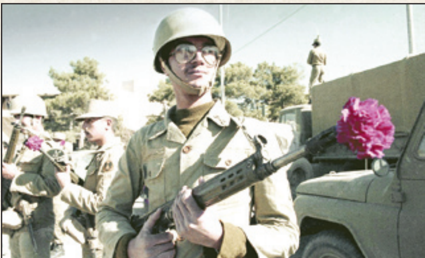
۴ کل نهادن بر لوله تفنگک ارتشیان، یکی از رویکردهای شاخص مردم، در دوران انقلاب به شمار می رفت. بسیاری از آنان، از این ابتکار انقلابیون خرسند بودند و با همان هیئت، در حضور مردم می ایستادند!