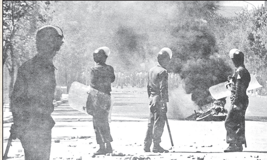
۱ ارتش پهلوی دوم، نمادی از وابستگی حکومت او به شمار می رفت! این نهاد، عمدتاً توسط مستشاران خارجی آموزش دیده و صرفاً برای دفاع از موجودیت و منافع حاکمیت پرورده شده بود! تصویر فوق آمده، برخی ماموران نظامی را در حال سرکوب یکی از تظاهرات نشان می دهد.