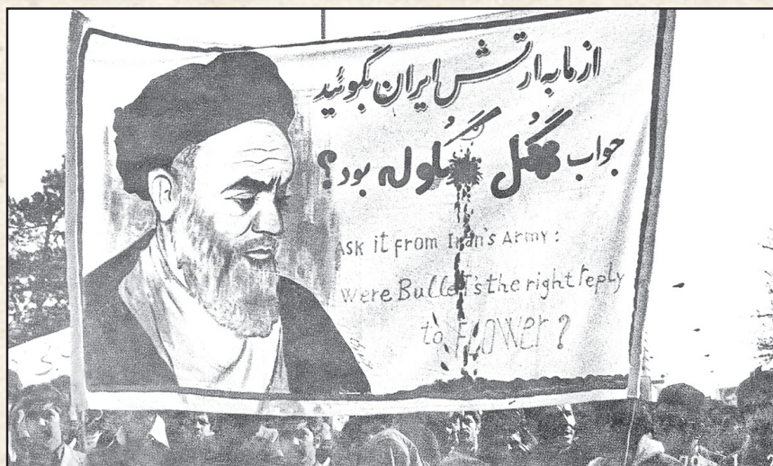
۷ از ماه به ارتش ایران بگویند: جواب گل گلوله بود؟، پلاکاردی در یکی از راهپیمایی ها که اندک نظامیان و قادری به شاه را به تجدید نظر می طلبد!

نظری به چند و چون بی اثر شدن مهم ترین ابزار سرکوب پهلوی دوم