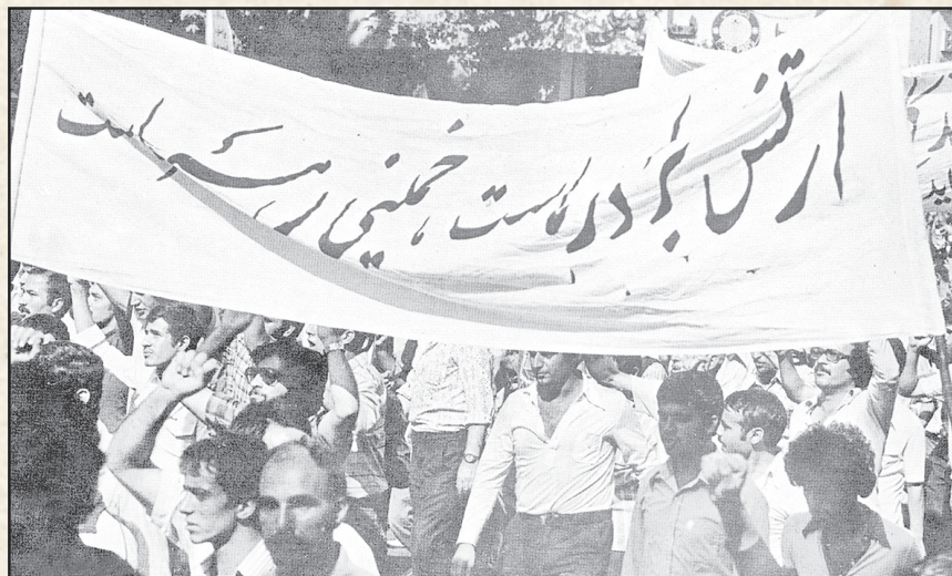
۲ امام خمینی رهبر انقلاب اسلامی اما اعتقاد داشت ارتش نمی تواند از تحولات کلان جامعه، تأثیر نپذیرد و هم از این روی، مردم را به ابراز علاقه به ارتشیان ترغیب نمود. در تصویر، راهپیمایان انقلاب اسلامی، پلاکارد ارتش برادر ماست/خمینی رهبر ماست را برافراشته اند.