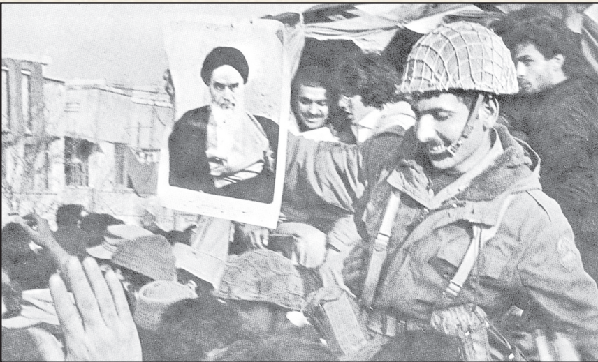
۶ در ۲۶ ماه ۱۳۵۷، یکی از افسران ارتش، تصویری از امام خمینی را در دست دارد و در شادی مردم از فرار شاه از ایران، شریک شده است!