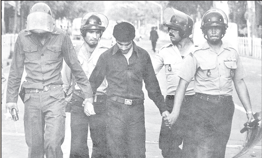
۲ ماموران ضد شورش شهبانی، در حاشیه یکی از راهپیمایی های مردم، جوانی را دستگیر کرده و به بازداشتگاه می برند! این فرآیند در ماه های آغازین سال ۵۷، تقریباً در ارتش فراگیر بود!