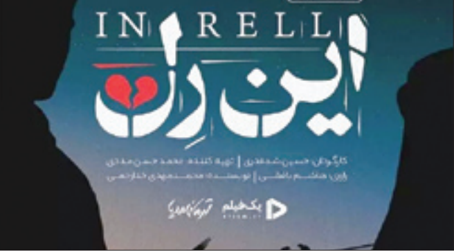
این رل، فیلم مستند ایرانی است.