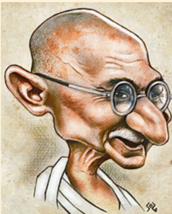
■ مهاتما گاندی