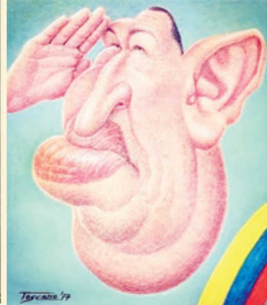
■ هوگو چاوز