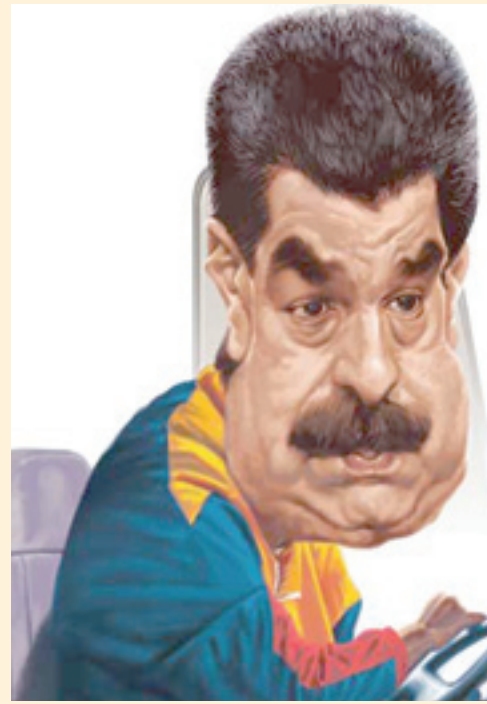
■ نیکلاس مادورو