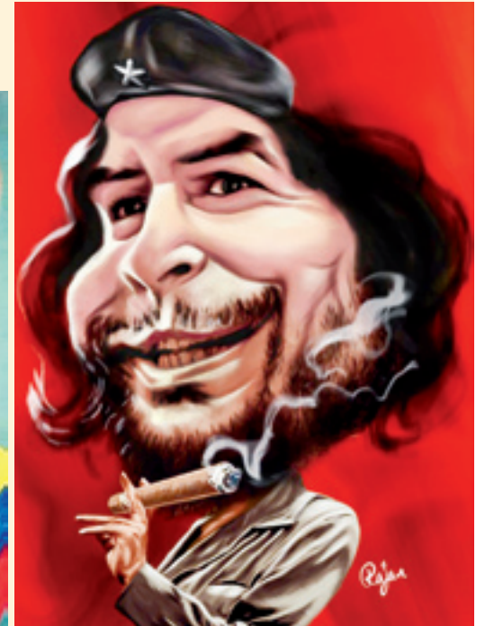
■ چه گوارا