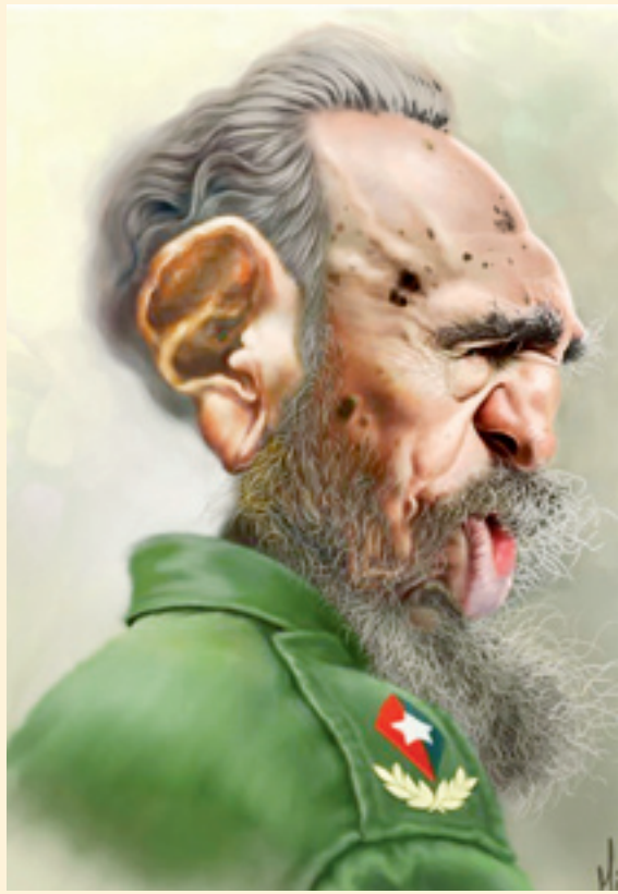
■ فیدل کاسترو