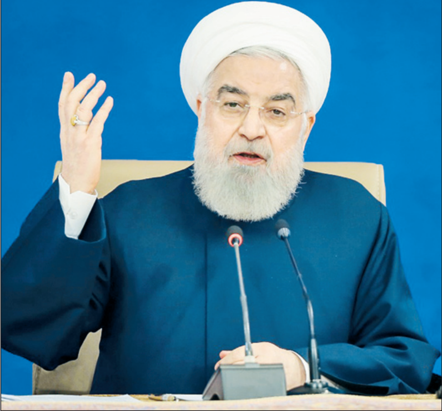
عبدی مرزاد افروز

رئیس‌جمهور که با شعار «تدبیر و امید» آخرین ماه‌های دولتش را می‌گذراند همچنان «امید» به رفع تحریم‌ها از طرف دولت واضع تحریم‌ها دارد و «تدبیر» او برای اجرای قانون مجلس آن است که آن قانون را با «تفسیر خودمان» عمل کند | صفحه ۲