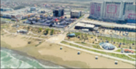
طرح کلی فاز اول احداث مجتمع تجاری و خدماتی اطعام حسینی در منطقه آزاد انزلی