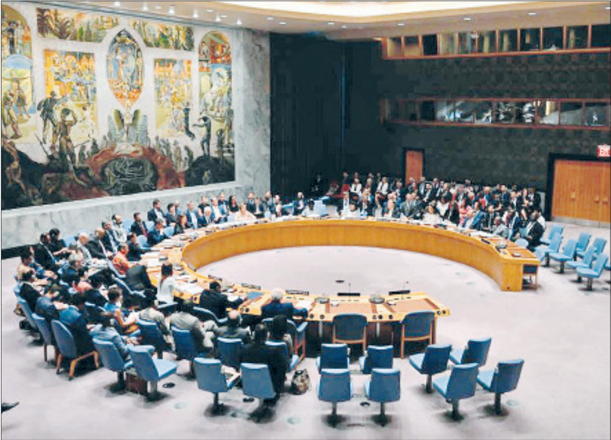
شکست ترامپ و نشست مذاکره به صورت آنلاین بوداست.

||| دوشنبه ۲۷ مرداد ۱۳۹۹ | ۲۷ | دی‌حجه ۱۴۴۱ |