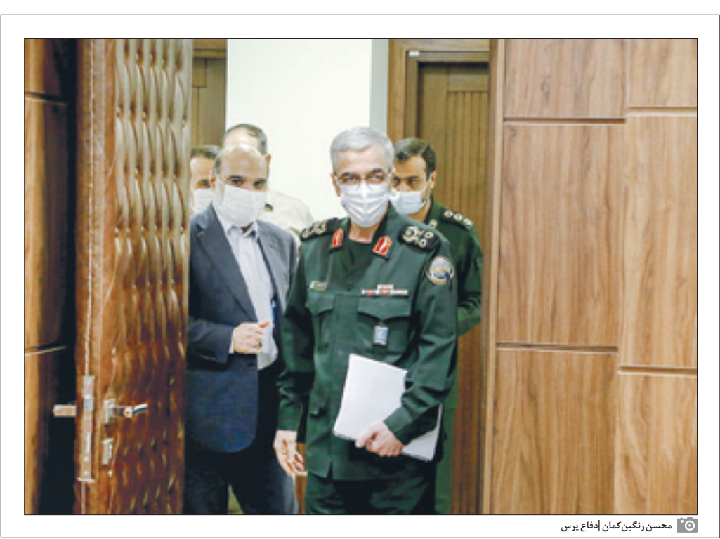
محسن رنگین کمان ایدفاع پرس

سر لشکر باقری: خدشه هر چند اندک شود ما آن را از چشم کشور امارات‌متحده عربی می‌بینیم و تحمل نخواهیم کرد