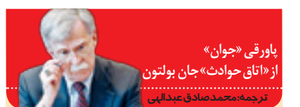
پاروقی «جوان» از «اتاق حواصت» جان بولتون ترجمه: محمدصادق عبداللهی

می‌توان به فهرست دلایل اروپا برای فیگور اخیر خود موارد دیگری را هم که متناسب با منافع خود آنهاست، اضافه کرد. آنچه نگران‌کننده است، رفتار بعضاً منفعلانه دولت مقابل بی‌عملی اروپا است که می‌تواند با مخفی کردن ابعاد فریبکارانه و مرده‌خواری اتحادیه اروپا، خسارت بیشتری به دنبال داشته باشد.