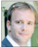
سید لو گاردین

نامی است که از سال ۱۹۵۷ برای این ورزشگاه در نظر گرفت شده و حالا اگر قرار باشد این نام به مدت یک سال به فروش برسد باید به نام جدید نیو کمپ عادت کرد. سران باشگاه اهداف بزرگی را در دستور کار داده‌اند. ساخت یک ورزشگاه ۱۰۵ هزار نفری یکی از همین اهداف است که البته محقق شدن آن نیاز به بودجه‌های هنگفت دارد. در حال حاضر نیو کمپ فعلی بزرگ‌ترین ورزشگاه فوتبال قاره اروپا به شمار می‌رود و اگر بودجه لازم مهیا شود، آبی‌واژی‌ها طی چهار سال می‌توانند ورزشگاه جدید خود را تأسیس کنند. کاتالان‌ها پس از ۶۳ سال قصد دارند در فصل ۲۰۲۱–۲۰۲۰ و به مدت یک سال نام ورزشگاه خانگی شان را بفروشند تا از طریق آن پروژه‌های دیگر خود را پیش ببرند. طبق برنامه اگر اسپانسر قابل اعتمادی با پیش‌بگذار و رقم خوبی پیشنهاد بدهد، پروژه کمک به مبارزه با کووید ۱۹ نیز هم‌زمان کلید خواهد خورد. ضمن اینکه اسپانسر هم این حق را دارد تا بخشی از مبلغ پیشین‌های اش را صرف خیریه کند. البته این اولین باری نیست که مدیران باشگاه چنین تصمیمی اتخاذ می‌کنند. در سال ۲۰۰۶ بود که نام یونیسف برای نخستین بار روی پیراهن بازیکنان نقش بست. بعد از آن پای بنیاد و هواپیمایی قطر به عنوان حامیان تجاری به بارسلونا باز شد. مدیران بارسا می‌گویند با فروش نام ورزشگاه بر نامه‌های شان به خوبی پیش خواهند رفت. در اطلاعیه رسمی باشگاه بر مبارزه با کرونا تأکید شده، به این ترتیب هواداران بارسا باید منتظر شنیدن نام جدید ورزشگاه محبوب خود باشند.