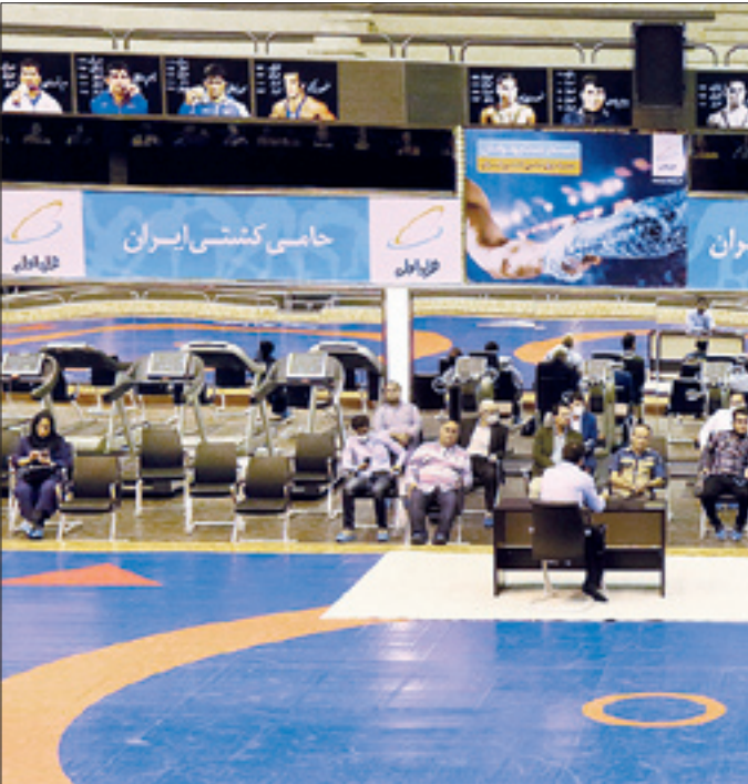
اینجمناسیون فدراسیون کشتی

برش‌هایی از نشست خبری علیرضا دبیر، رئیس فدراسیون کشتی