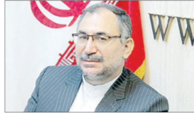
نایب‌رئیس فراکسیون محرومیت‌زدایی و گروه‌های جهادی مجلس در گفت‌وگو با «جوان»:

در حال حاضر هزاران پروژه عمرانی نیمه‌تمام در کشور وجود دارد که بر اساس گزارش‌های رسمی به حدود ۷۰۰ هزار میلیارد تومان سرمایه برای تکمیل شدن احتیاج دارند. اما بسیج سازندگی با استفاده از ظرفیت‌های مردمی و نیروهای بسیجی وارد پروژه‌های مختلف شده و برنامه خاصی برای تکمیل و به بهره‌برداری رساندن آنها دارد. کاری که به گفته