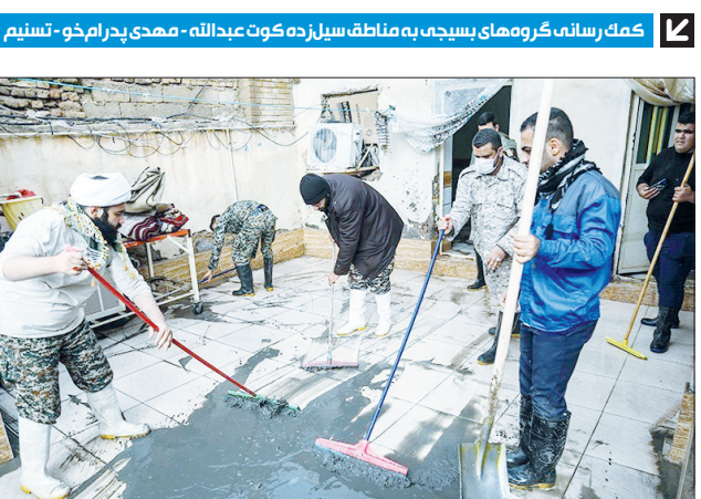
کلم رسانه گروه‌های بسیج به منطقه سیل‌زده کوه عبدالله - مهدی پدram خو-تسیم