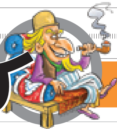
دبیر صفحه: مسعود دانش منش