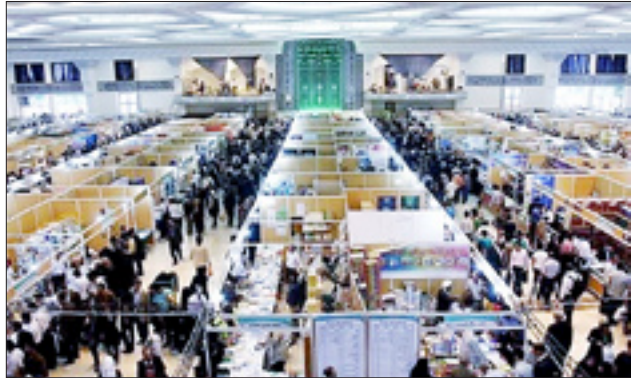
باران، بساط بخش‌هایی از سالن‌های مسقف نمایشگاه کتاب تهران را به هم زد