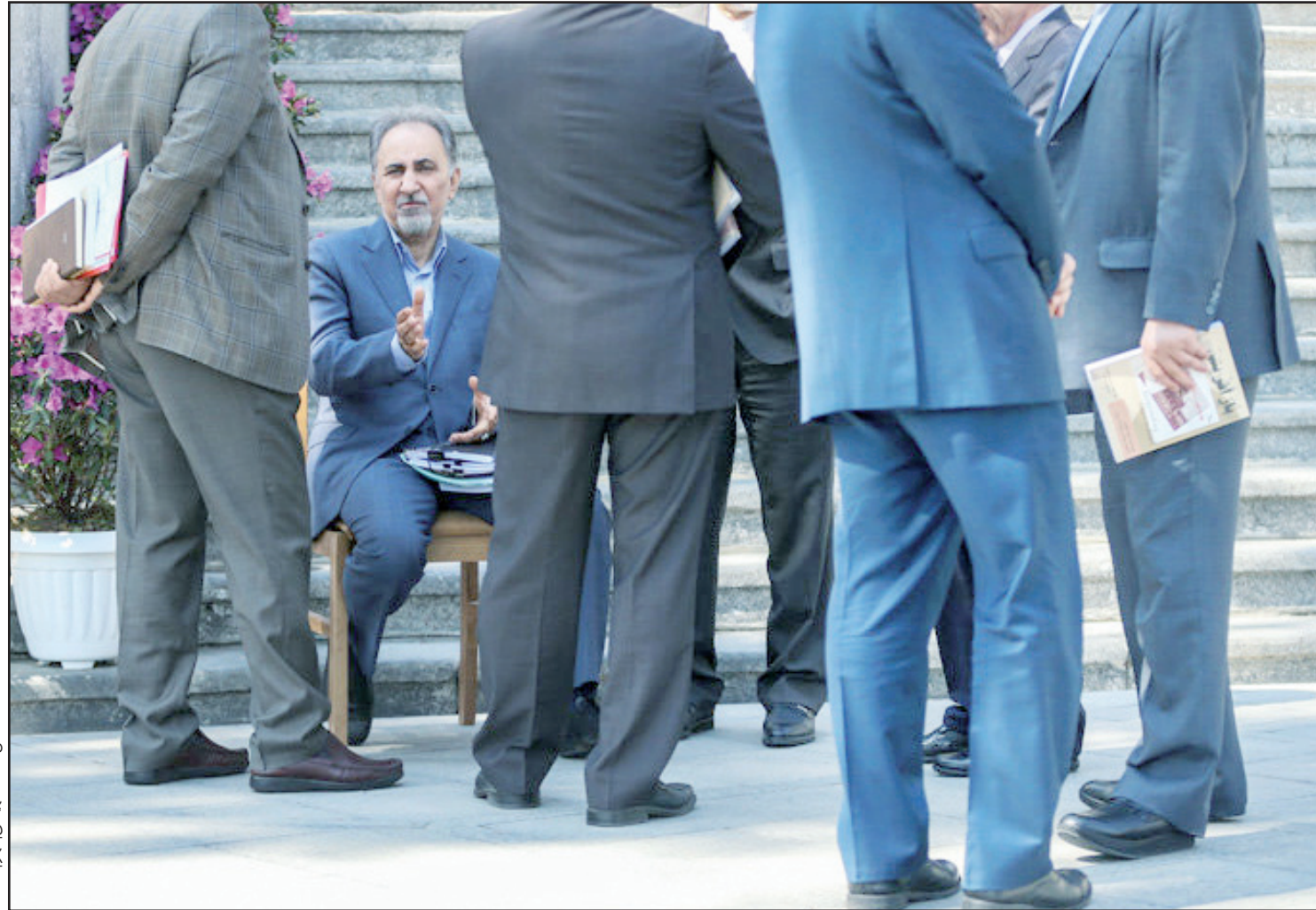
امیر اصبح ۲

بول از کشور خارج کرده است. | بقیه در صفحه ۳