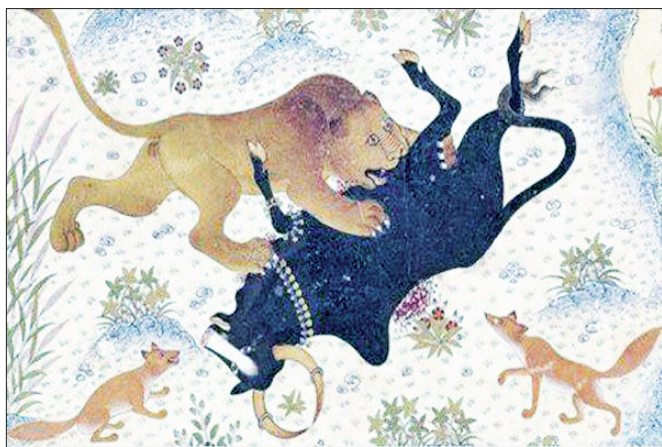
اکران یک انیمیشن ایرانی بر اساس داستان‌های اخلاقی کهن