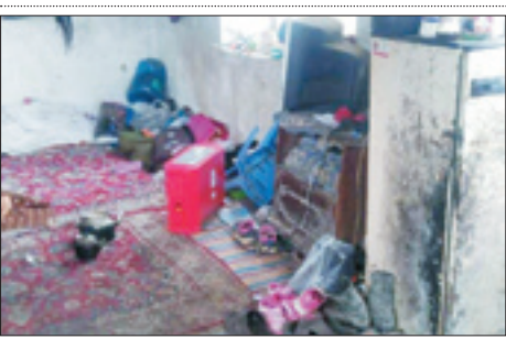
توییت ابوریحان ترفوتی:

در این ستون پیام‌ها، متن‌ها، عکس‌نوشته‌ها و خبرهای کوتاه منتشر شده در فضای مجازی را منتشر خواهیم کرد؛ بدون هیچ‌گونه توضیح و تفسیر. با نشر این موارد هم به منزله تأیید یا رد محتوای هیچ کدام از آنها نیست.