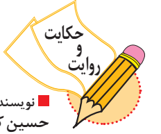
نویسنده و تصویرگر: حسین کشتکار