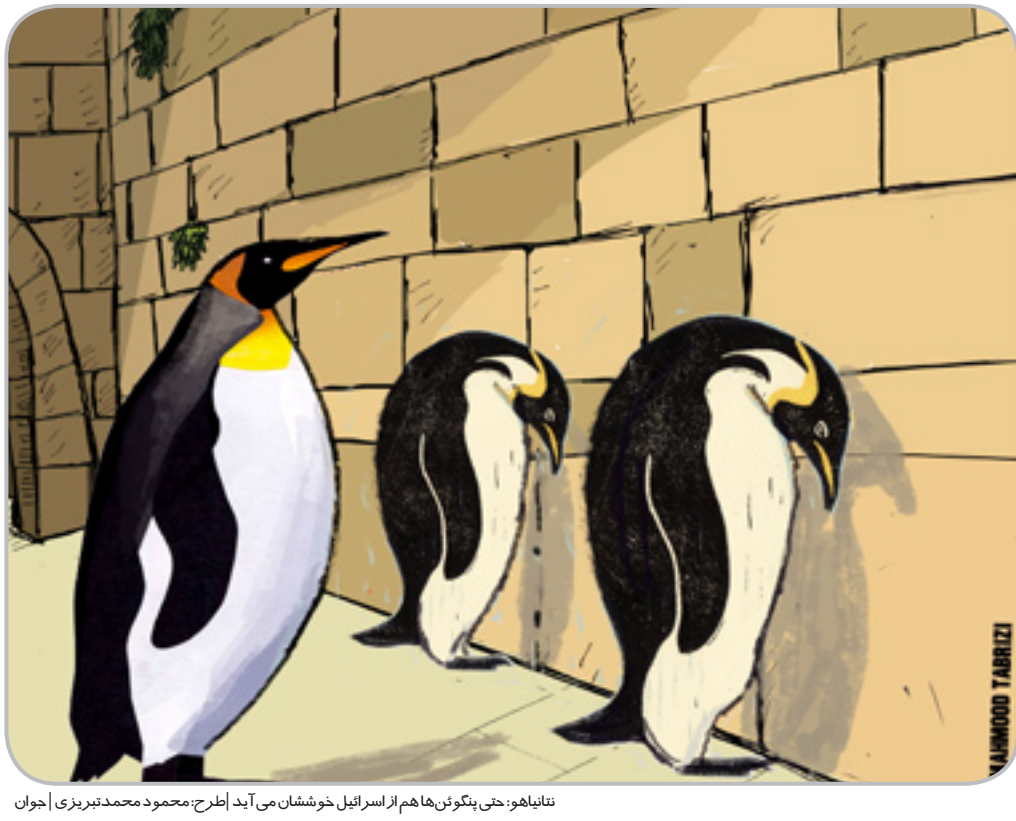
نمایاها: حتی پنگوئن‌ها هم از اسرائیل خوششان می‌آید | طرح: محمود محمدنیریزی | اجوان

واکنش رئیس کمیته نیم‌بها سازی بلیت سینما در شورای صنفی نمایش که اصرار داشت نامش فاش شود، در مورد نیم‌بها سازی بلیت سینما گفت: «خوشبختانه اعضای این شورا به جهت علاقه به سینما، چندین سال بود به دنبال این امر جالب توجه بودند که بالاخره موفق شدند. در همین راستا کمیته نیم‌بها سازی بلیت سینما تصمیم به نیم‌بها سازی بلیت سینما گرفت.» وی افزود: علت این اقدام کمیته نیم‌بها سازی بلیت سینما در جهت افزایش استقبال مردم از سینماها است. لازم به ذکر است، ایشان، قبلاً دلیل گران شدن بلیت سینماها را نیز استقبال مردمی عنوان کرده بودند. در آخر نیز وی در پاسخ به این سؤال که «چرا بلیت سینما را گران کردید که بعداً بخواهید برای افزایش استقبال مردم، روز ملی سینما را به هفته دفاع مقدس ربط دهید؟» به دوربین خبرنگار ما نگاه کرد و گفت: «اگر فکر کرده‌اید می‌توانید از زیر زبان من چیزی بیرون بکشید، سخت در اشتباهید. نیم‌بها سازی بلیت سینما توسط کمیته نیم‌بها سازی بلیت سینما هیچ ربطی به رایگان شدن بلیت در روز ملی سینما در سال‌های قبل ندارد، ضمن این که اقدام کمیته نیم‌بها سازی بلیت سینما در جهت نیم‌بها سازی بلیت سینما در نزدیکی هفته دفاع مقدس اصلاً کار سختی نبود و اگر این کار تأثیر مورد نظر بر استقبال مردم از سینما را نگذارد، برنامه اولویت اصلی ما، نیم‌بها سازی بلیت سینما در مناسبت‌هایی چون روز جهانی بهداشت، روز جهانی خودکشی، روز ملی اطلاع رسانی هیاتیت و روز جهانی ماما است.» گفتنی است منابع موثق، معتقدند رئیس کمیته نیم‌بها سازی بلیت سینما در شورای صنفی نمایش، در گذشته رئیس شرکت شقیقه پروان ساز کار با محیط زیست بوده است.