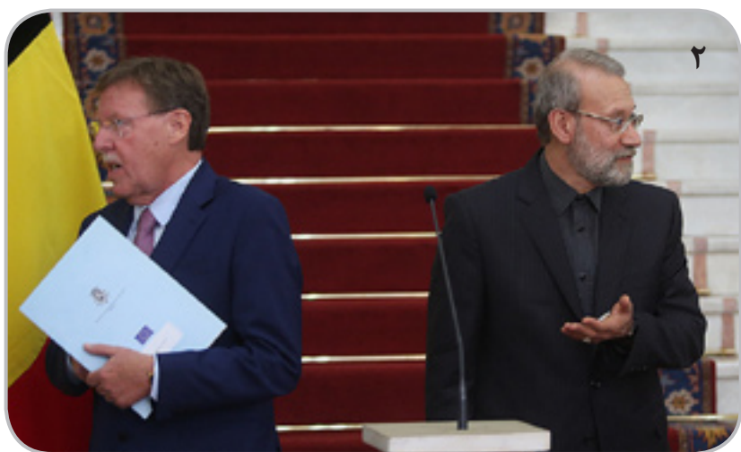
-این چرا قهر کرد؟ اصلاً جنبه شوخی نداره!

واکنش خبرها حاکی از آن است که در پی جوش و خروش بیش از حد ترامپ، گندش در آمد و رسوایی به بار آمد. ماجرا از این قرار است که وی، مذاومتاً بر سر کره شمالی داد زد و به این فکر نکرد که جواب «های» «هوی» است؛ اما کره شمالی گفت: داداش! اگه تو شری، من خرم. حالا که اصرار داری، مشکلی نی که؛ بیا دعوا. در پی این پاسخ، آمریکا نم برداشت. وی افزود: غلط کردیم به پیونگ یانگ گفتیم کینگ کونگ، کینگ کونگ چد و آبادمونه. ترامپ، قلمه، برای مصرف داخلی، به قمبزی در کرد؛ شما چرا به خودت گرفتی؟! در ادامه، مقامات آمریکایی، برای تأثیر بیشتر، در پیام‌های جداگانه‌ای به نوبت تأکید کردند: از پیونگ یانگ خواهشمندیم گودزیلا نشود. و اصرار کردند: پلیز، پلیز، پلیز! در حالی که حالی‌شان شده بود گول تجربیاتشان را خورده‌اند که انتظار داشته‌اند پیونگ یانگ، با مقدار محاسبه شده‌ای از توپ و شتر، جشن بتن‌ریزان برای هسته‌ای و موشکی‌اش برپا کند و در سال‌های آتی اش نیز سالگرد این حماسه غرور آفرینش را گرامی بدارد. در پایان، ترامپ هم، برای جبران سوتی فرافکنانه‌اش، اقدام به فروفکنی برای مصرف خارجی نمود و با بیان سخنانی نژادپرستانه، آش اختلافات آمریکایی‌ها را هم زرد و معجونی شبیه جنگ‌های داخلی آمریکا را نوید داد.