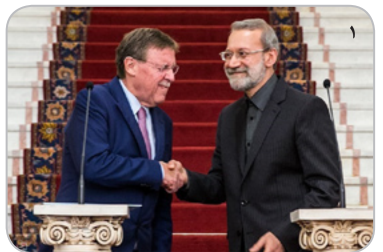
-آخ فشارنده... غلط کردم... جون مادرت ول کن...