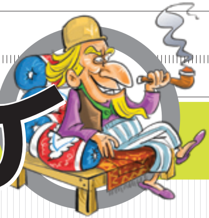
دیپر صفحہ: مسعود دانش منش

روزنامه اخبار ولایات محروسه وسط آباد نمره شصت و یکم / مهرماه ۱۳۹۶