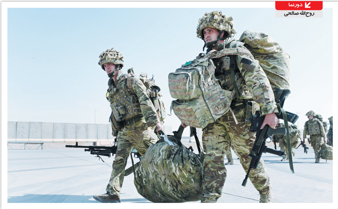
درونما روح‌الله صالحی

استراتژی ترامپ هم به خروج از افغانستان نینجامید