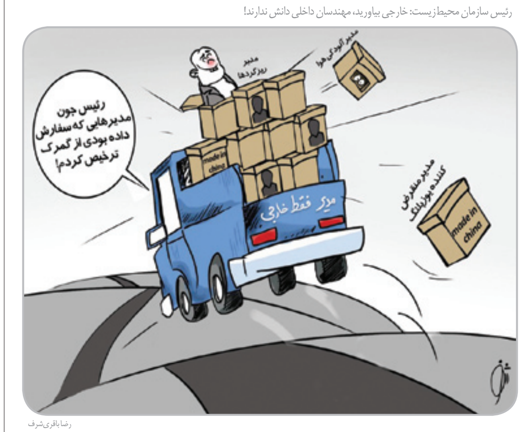
رضا باقری شرف

رئیس فراکسیون امید مجلس، در پاسخ به سؤال خبرنگاری مبنی بر اینکه نظر شما درباره ژن خوب که فرزندتان مطرح کرده چیست، گفت: «فرزند همیشه شاگرد ممتاز بود، همچنین شاگرد اول کلاس می شد، البته در هر مسابقه ای از دبستان تا الان هم که شرکت کرده اول بوده است.» همچنین وی از مسابقه محله که گام بلندی در راستای شایستگی و لیاقت و افزایش تراز رزومه فرزندش داشته تشکر کرد. - اتفاقا من هم یک پسر عمو داشتم که همیشه شاگرد اول می شد، بعد یکپهوی یک اپراتور تلفن همراه به نامش شد! ما هم مردیم از تعجب، ولی بعدا فهمیدیم کلا توی کشور رسم است که هر کس شاگرد اول شود صاحب اپراتور می شود!