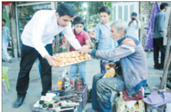
دسته‌شادی جمعی از طلاب در مناطق محروم حاشیه تهران راه‌های هدیه به کودکان به همت گروه فرهنگی بارش مهریانی