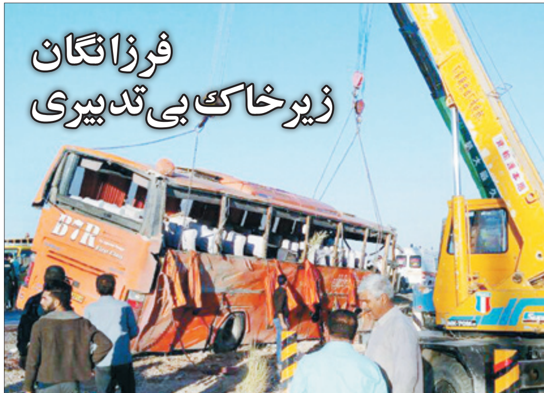
اتوبوس اردوی فرزانگان هرزگان در حادثه‌ای با ابعاد ملی و مقصران متعدد واژگون شد که به مرگ ۱۱ دانش‌آموز و مصدومیت ۲۴ نفر انجامید | صفحه ۱۴