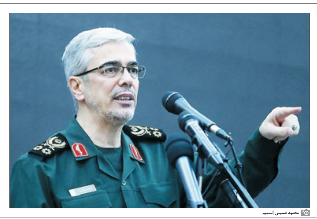
محمود حسینی اسنیم

بلوچستان که با شرکت عشایر بلوچ در منطقه پیشین جریان داشت در انفجاری انتحاری به همراه برخی از فرماندهان سیاه و عشایر بلوچستان این سردار شهید را به شهادت رساندند. حالا با گذشت سال‌ها از شهادت این شهید بزر گوار میراث این مجاهدت در استان سیستان و بلوچستان در حال رشد است و به درختی تناور تبدیل شده که چشم تمام دشمنان را کور کرده‌است. رؤسای طوایف و گروه‌های مختلف در سیستان و بلوچستان امروز به تأمین کننده امنیت بومی استان تبدیل شده‌اند و