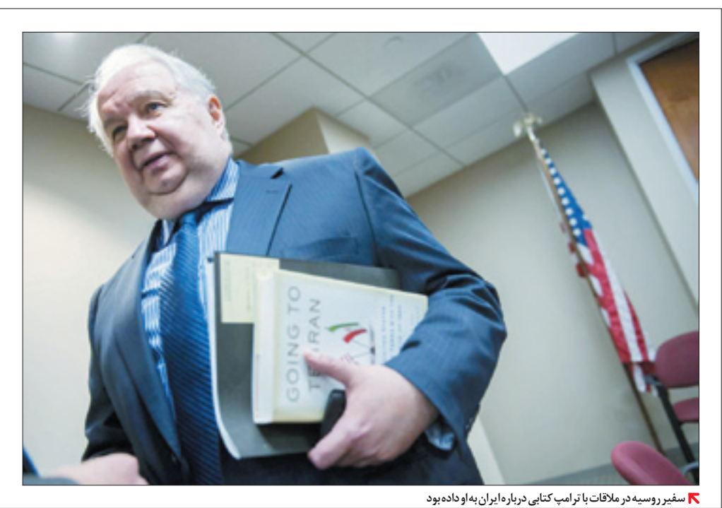
✚ سفیر روسیه در ملاقات با ترامپ کتابی دربارهٔ ایران به او داده‌بود

با روسیه و ایران در سوریه همکاری خواهیم کرد