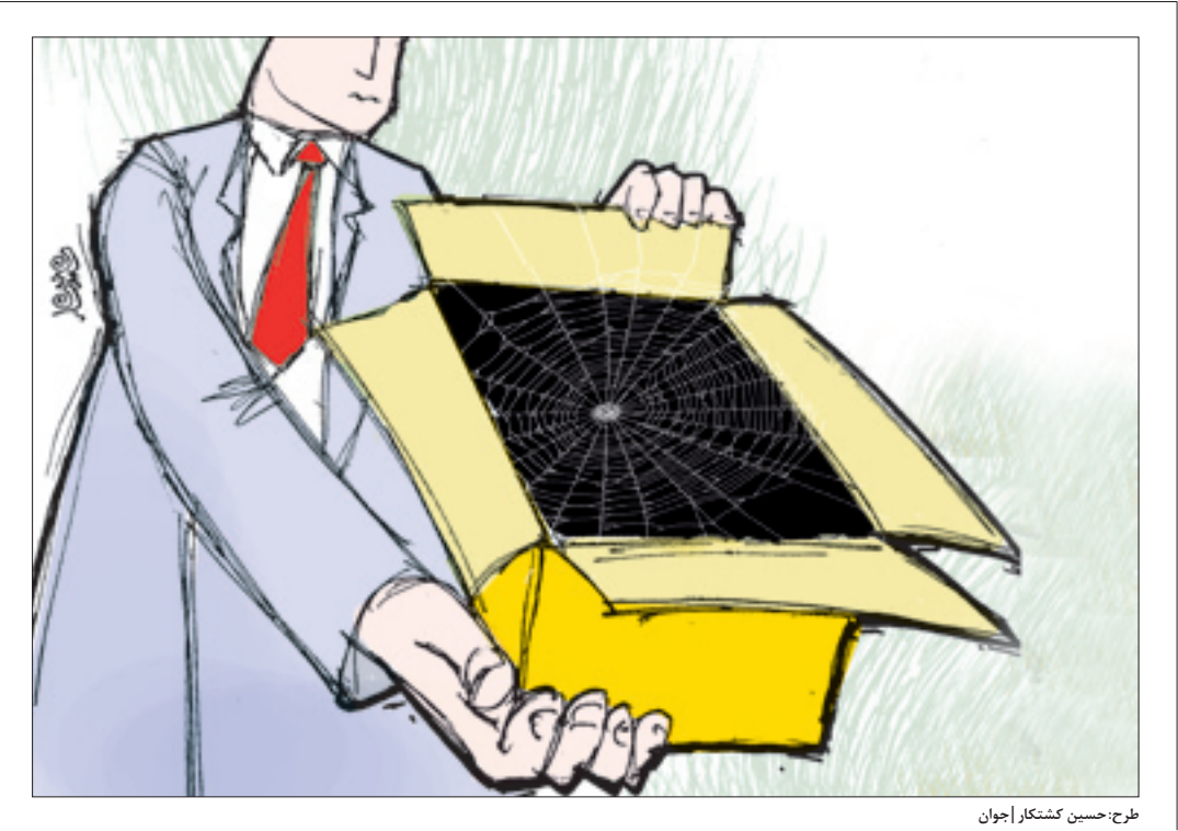
طرح: حسین کشکار | جوان

فراتر از تحریم نهادهایی که رفتار آنها نمونه انقلابی‌گری است، امریکایی‌ها تلاش کرده‌اند روحیه انقلابی‌گری را با کمک برخی شخصیت‌ها و رسانه‌های غربی باور داخلی، معادل تندروی در فرهنگ عمومی نهادینه سازند و از سوی دیگر تلاش شده تا ریشه‌های فرهنگی آن در کتب درسی تخطئه و سپس حذف شود، به همین دلیل است که رهبر معظم انقلاب اسلامی در سال گذشته با طرح پرسش انتقادگونه مقام معظم رهبری از وزرای علوم، تحقیقات و فناوری و آموزش و پرورش می‌فرمایند: «چرا هیچ نشانی از کتاب‌های مربوط به اسناد جاسوسی در مجموعه دروس مدارس و دانشگاه‌ها نیست؟» و از تقلیل روحیه انقلابی‌گری، استکبارستیزی و دشمن‌شناسی در نسل‌های بعدی انقلاب اسلامی نگران است.