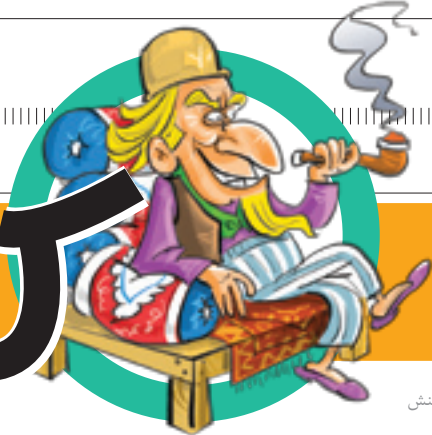
دبیر صفحه: مسعود دانش‌منش

روزنامه‌چهارم اخبار ولایات محروسه وسط‌آباد نمره چهل و یکم / اردیبهشت‌ماه ۱۳۹۶