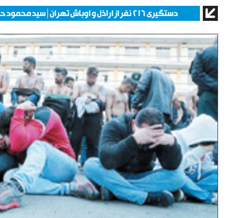
دستگیری ۲۱ نفر از اراذل و اوباش تهران سید محمود حسینی | تنظیم