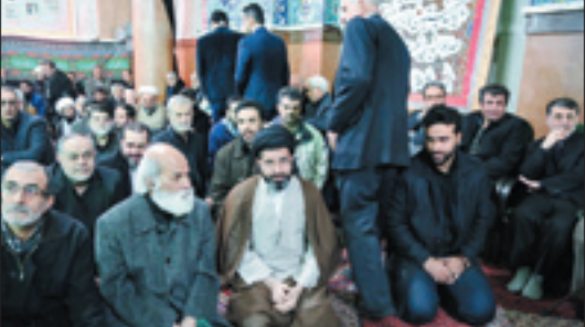
حجت‌الاسلام سید مسعود خامنه‌ای

سردار مسعود جزایری معاون ستاد کل نیروهای مسلح در حاشیه مراسم ختم مرحوم حسن شایانفر اظهار داشت: ایشان یکی از افراد بی‌ظنلیری بود که در امر جریان‌شناسی و شناخت جریان‌ها و شخصیت‌های سیاسی خدمات ارزشمندی را به جامعه ارائه داد. بخشی از این خدمات به‌طور مکتوب توسط مؤسسه وزین کیهان به چاپ رسیده و