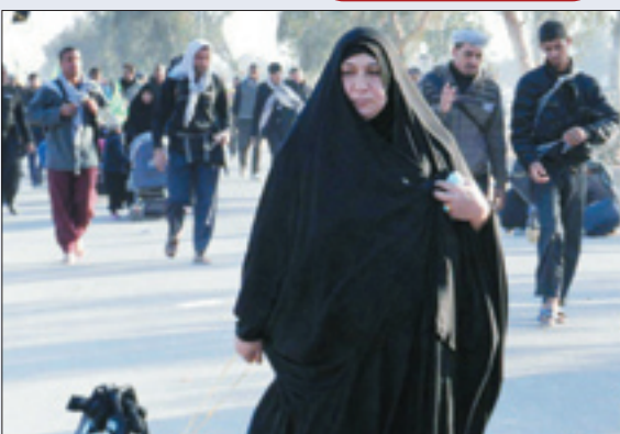
شعار «الهی احامی ابداً عن دینی» و رنگ قرمز برای پیاده روی اربعین ۹۵ تعیین شد