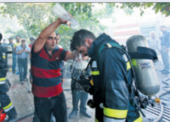
شهروند اصفهانی آتش نشان رادر پایان مأموریتش خنک می کند