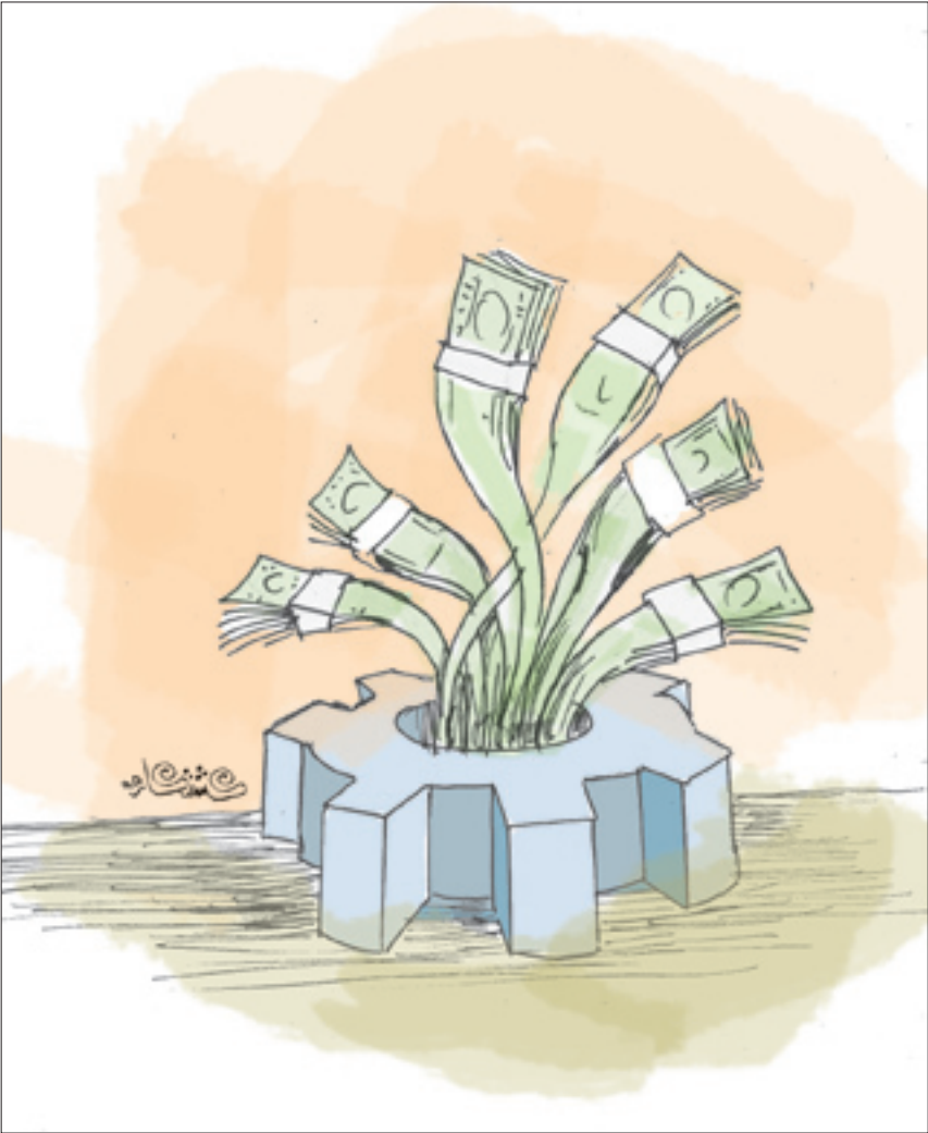
نمایش فیلم «جم» در جشنواره فیلم فجر

اظهار بی‌اطلاعی تهیه‌کنندگان سینما از یخش دوباره تیزرهای سینمایی در «جم»