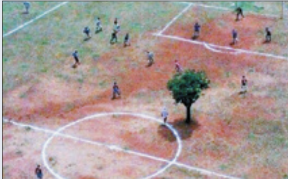
برای هندی‌ها همان قدر که چمن اهمیت دارد، درخت هم مهم است