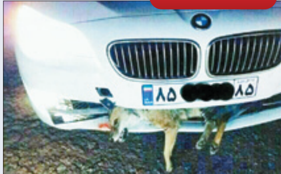
روباهمانی که هر روز در جاده‌ها کشته می‌شوند از شمار خارج است