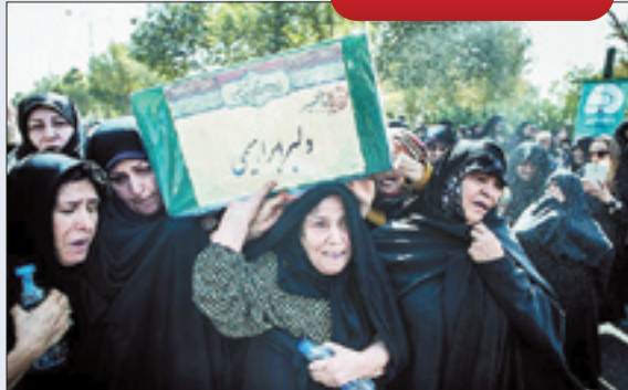
۵ شهید مدافع حرم بر دستان مادران قهرمانشان تشییع شدند