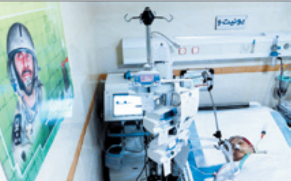
مادر قهرمان ملی ایران بستری شد. ما هرگز زمانی را که رهبر انقلاب مقابل تابوت شهید صیاد شیرازی زانو زدند و تابوت را بوسیدند، فراموش نمی‌کنیم